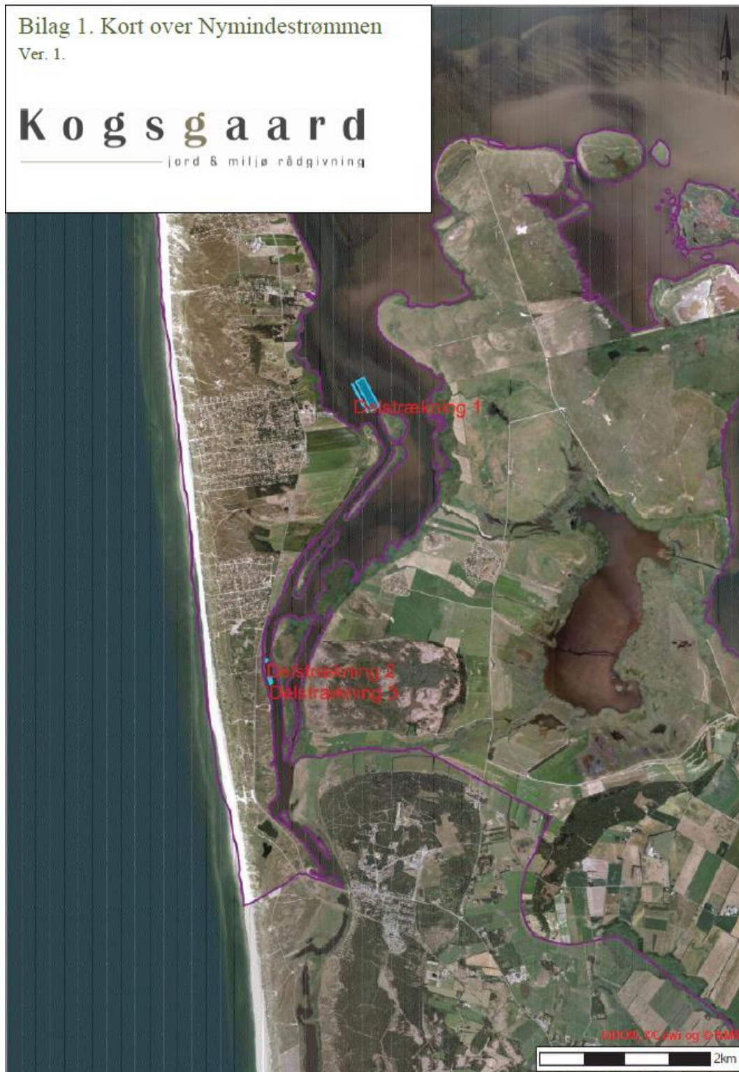
Figur 1: Projektområde som ligger ned mod Nymindegab i bunden af Ringkøbing Fjord (kortet er taget direkte fra ansøgningsmaterialet)