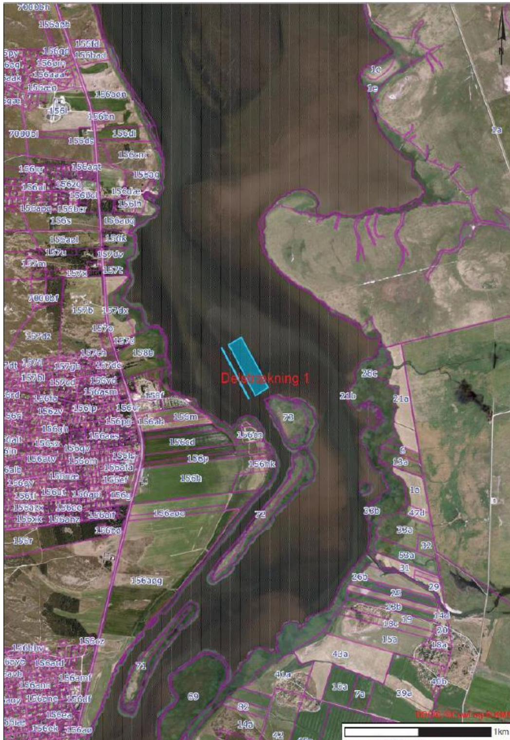
Figur 2: Renden ved Bjerregård der ønskes oprenset (tynd blå linje) samt forslag til bypass område (bred blå markering). (Kortet er taget direkte fra ansøgningsmaterialet)